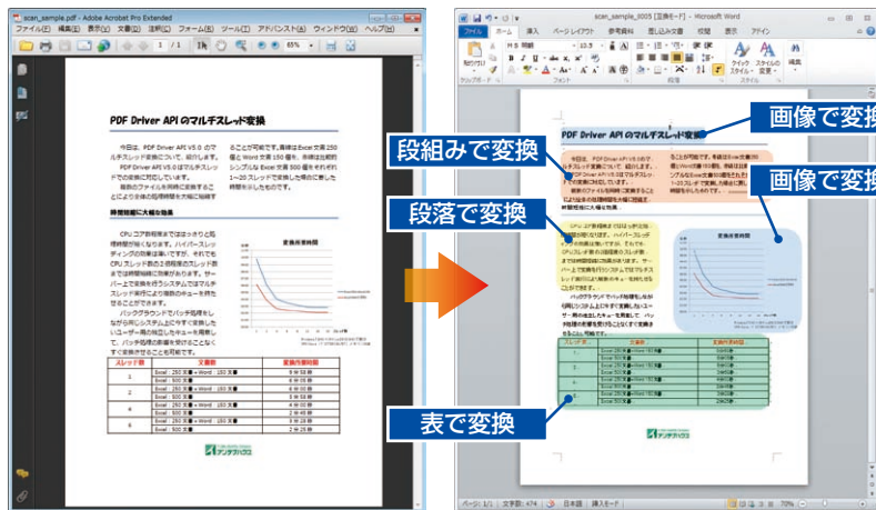
スキャナで作成したPDF原稿